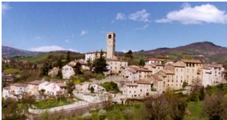
Veduta del Castello (Foto GIORGIO – Macerata Feltria).

...adagiata in una conca verdeggiante, al confine tra Marche, Romagna e Toscana, nel cuore del Montefeltro, mostra un paesaggio di grande suggestione.